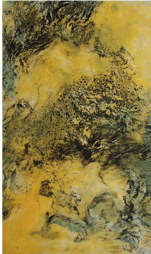
„Swarms“ Enkaustik und Tusche auf Leinwand, 2016, 150 x 90 cm