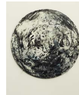
3 Scheiben o.T., Enkaustik und Tusche auf Leinwand, 2016, Durchmesser 30 cm